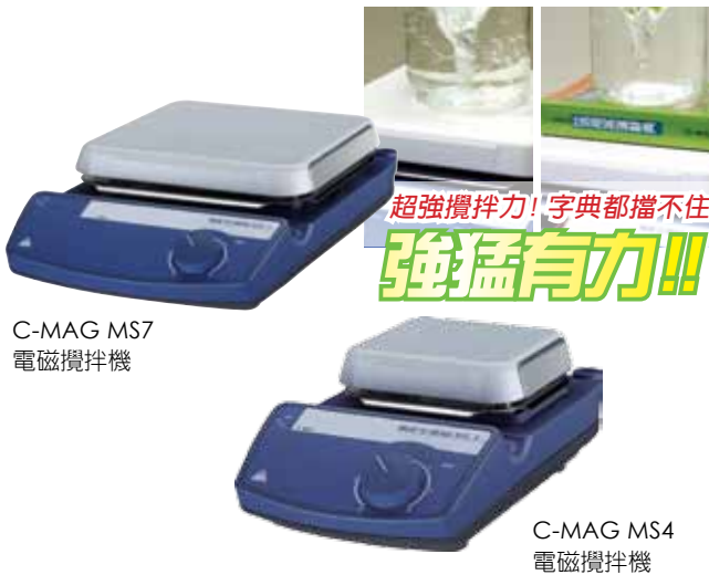
C-MAG MS7 電磁攪拌機