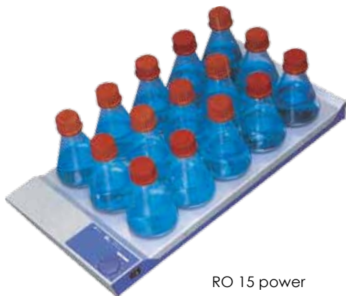
RO 15 power