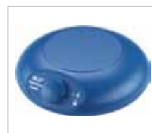
Topolino mobil 攜帶型 充電 2-3 小時可使用 8-12 小時、亦可外接電源